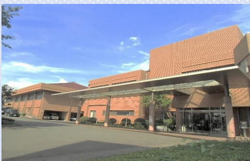
特別養護老人ホーム明風園（前橋市）