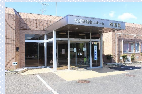
特別養護老人ホーム菱風園（桐生市）