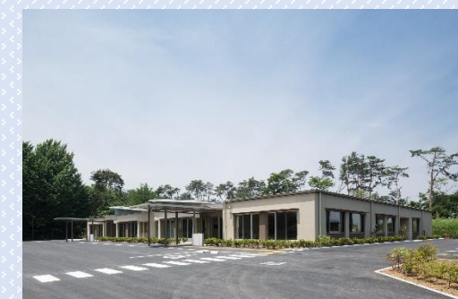
館林市障がい者総合支援センター(館林市)