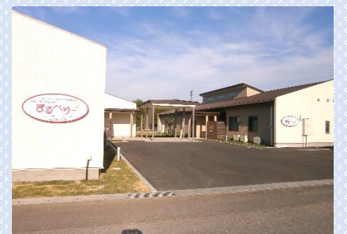
障がい者支援センターまるべりー（伊勢崎市）