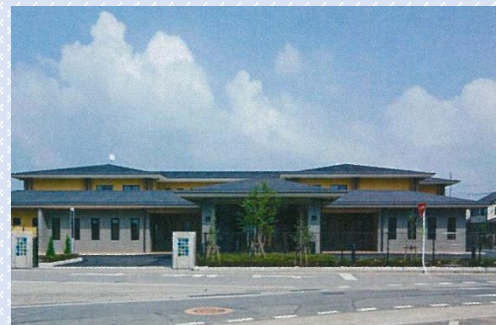
特別養護老人ホーム高風園「そめやの里」(高崎市)