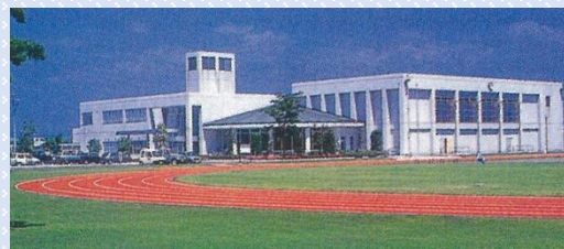
群馬県立ふれあいスポーツプラザ（伊勢崎市）