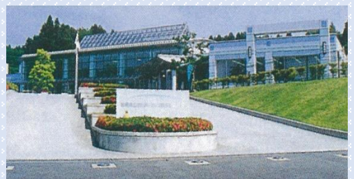
群馬県立ゆうあいピック記念温水プール（渋川市）