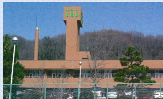
特別養護老人ホーム高風園（高崎市）